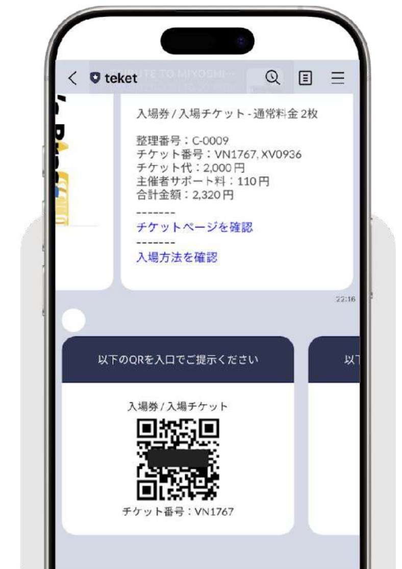
LINEに表示されたチケット