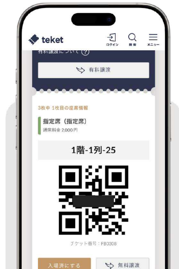
teketのマイページのチケット