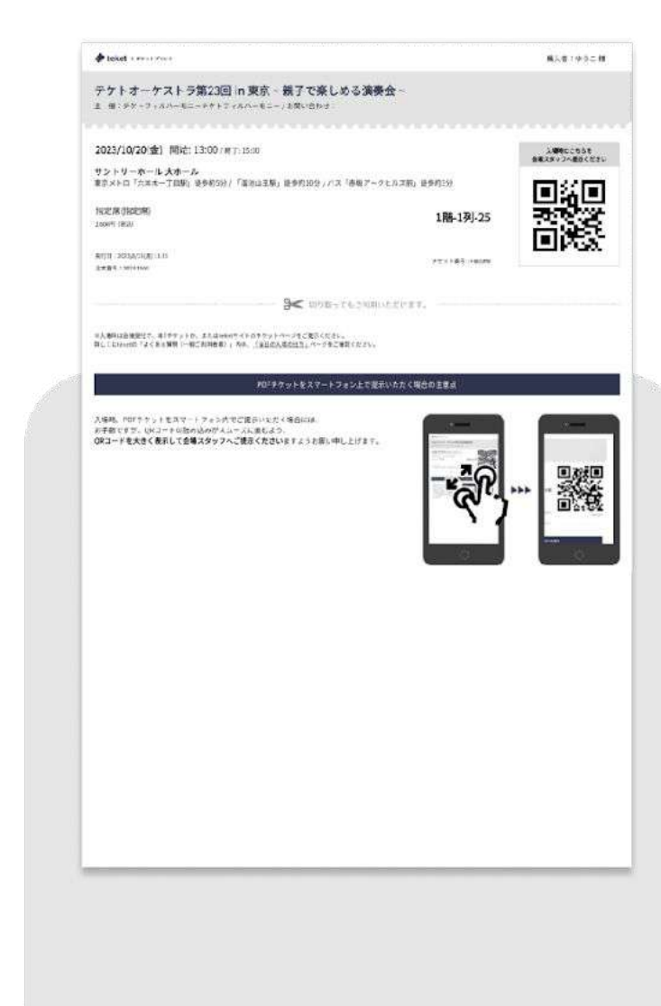
PDFを印刷した紙チケット