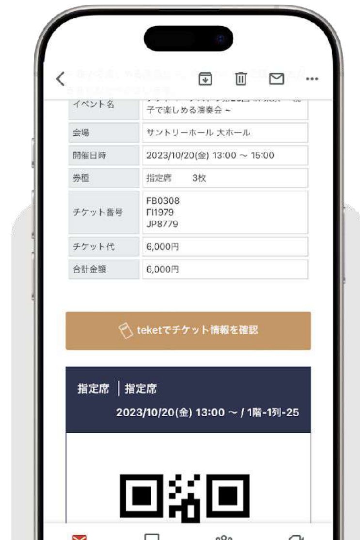
チケット購入完了メール