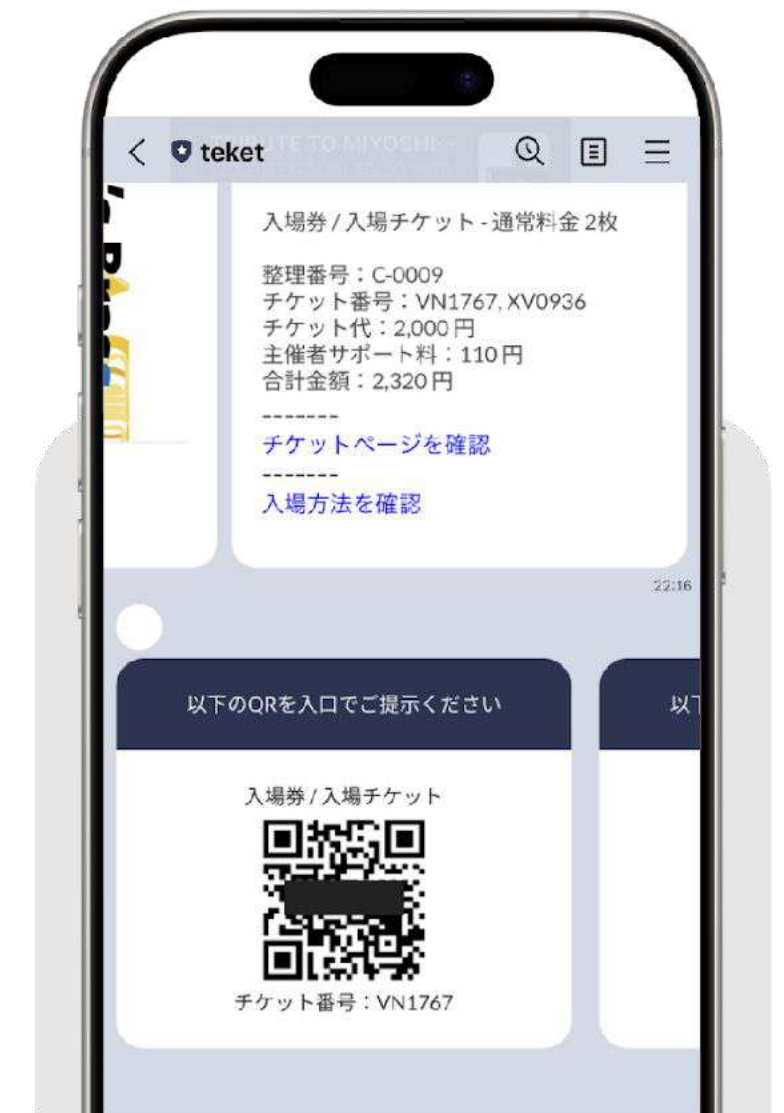
LINEに表示されたチケット