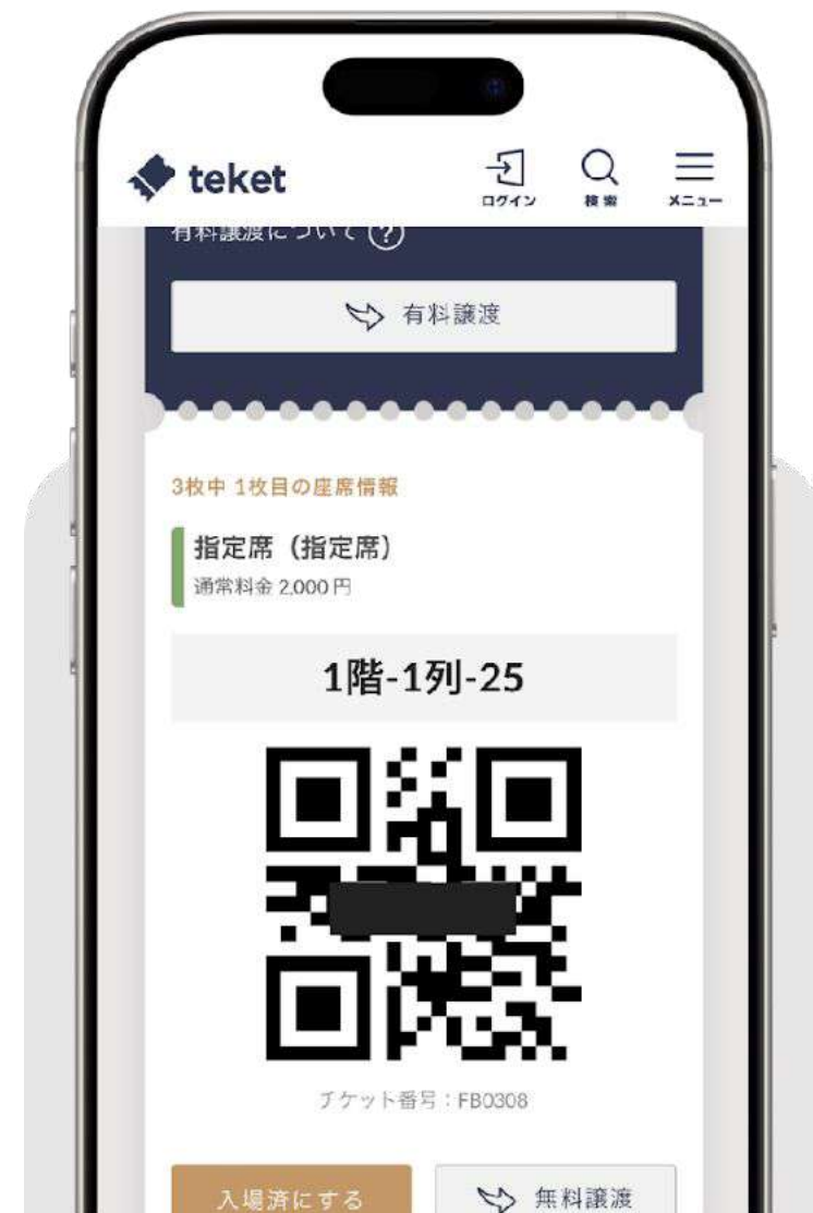
teketのマイページのチケット