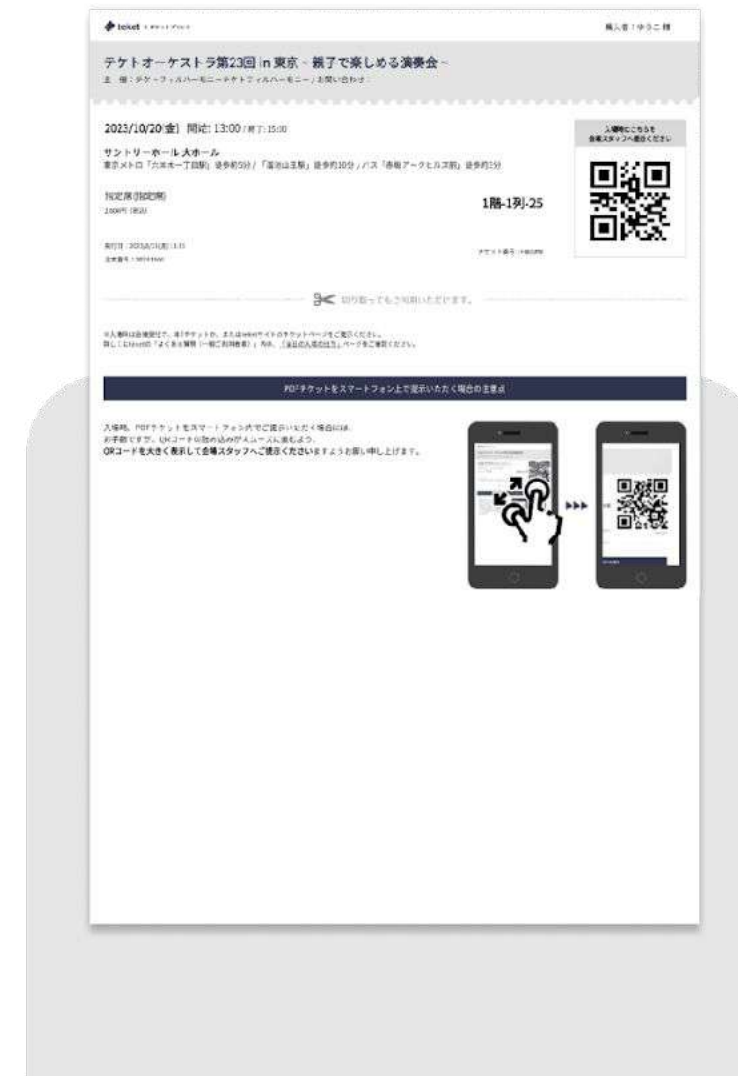
PDFを印刷した紙チケット